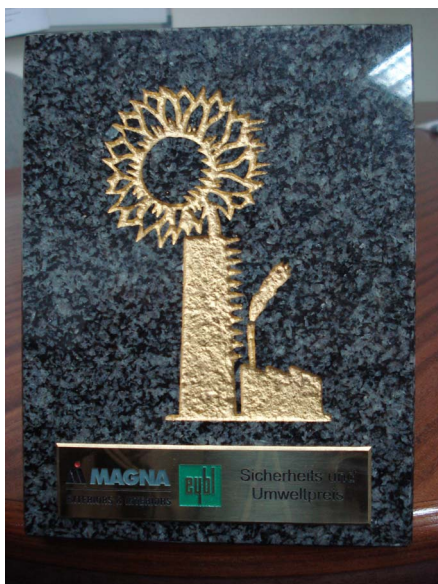
Abbildung des Sicherheits- und Umweltpreises