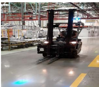
Blaulicht vor einem Stapler