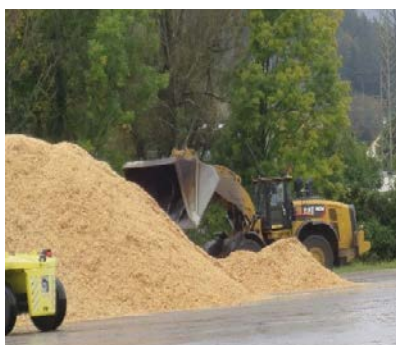
Dachkamera am Radlader zur besseren Übersicht